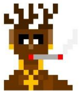
Notorious Rudolph (Sieger 2023)

GALOPO verneigt sich vor dieser Leistung.